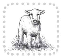
"El cordero, hijo mío, lo proveerá Dios."