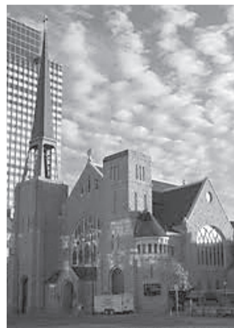
Primera Iglesia Bautista de Hungría

ley también se aplicará a las clases de religión, estando ello garantizado y financiado en las Escuelas Públicas.