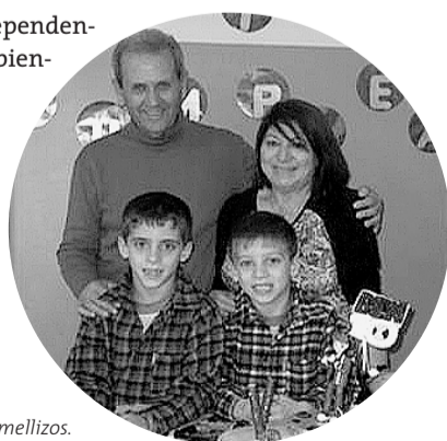
Festejo de cumpleaños de los mellizos.

Como matrimonio estamos agradecidos al Señor de ver a nuestros hijos bien, creciendo sanos, amando a Dios y conociendo más de Jesús. Celebramos con sus abuelos maternos, amiguitos y hermanos en Cristo, sus ocho años.