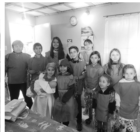
Niños preparados para el pesebre.