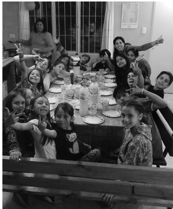
Dispuestos a cenar.

Todo lo realizado apunta a formar a Jesús en ellos; a saber amar a Dios y a los demás, a compartir, a perdonar, a poner sus esperanzas en Dios. Y como la mayoría son chicos que sus padres no son creyentes, necesitan pasar tiempo con personas creyentes, en un ambiente cristiano que los contenga y les enseñe el camino de la verdad. Es por esto que hacemos todas estas actividades.