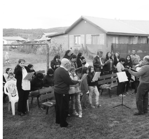
Alabando en el culto de Navidad.

Terminamos la jornada cenando juntos y compartiendo gratos momentos de alegría y comunión en el Señor.