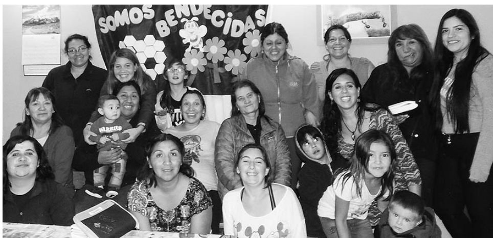
Celebración del día de la mujer.

Iniciamos la meditación reflexionando sobre tres conceptos importantes: AUTOCONCEPTO-AUTOESTIMA-AUTOACEPTACIÓN.