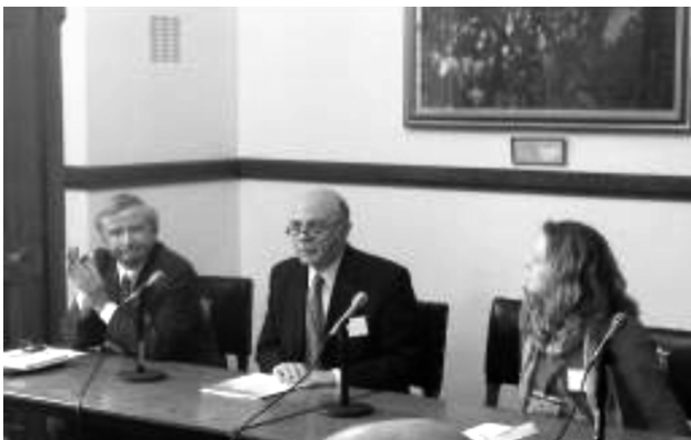
Seminario “La Biblia, palabra para el mundo”

“Una iglesia global del siglo XXI debe amar a los pobres y las víctimas... desafiar a los opresores y apoyar a las víctimas. Debe hablar por las mujeres asesinadas en los linchamientos llamados “asesinatos de honor”, o por los encarcelados bajo las leyes de