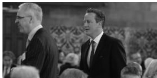
James Catford de Sociedad Bíblica y David Cameron Primer Ministro

“La iglesia global es sobretodo la iglesia de Dios, por todos sus defectos y en una devoción apasionada a Él, le ofrecerá el tesoro