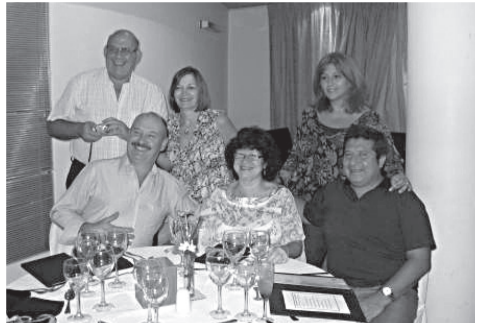
Matrimonios de la Iglesia de Ramos Mejía