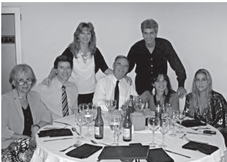
Matrimonios de las Iglesias de José C. Paz, Rosario y Ramos Mejía