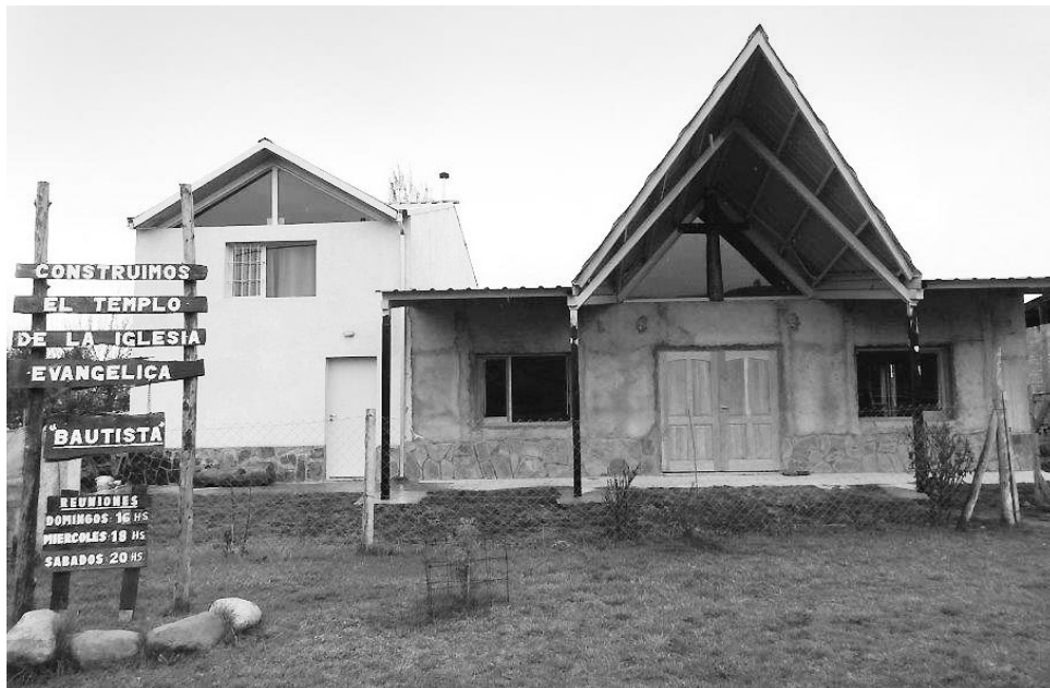
Frente exterior del templo con la cruz en la entrada.

Cuando llegamos al pueblo a fines del año 2011 los hermanos habían podido comprar un terreno de 20 metros de frente por 60 metros de fondo y con las primeras ofrendas recibidas se compraron materiales como para comenzar la construcción. Y desde entonces en forma continua trabajamos para ver hoy un hermoso templo, con instalaciones adjuntas y amplio terreno.