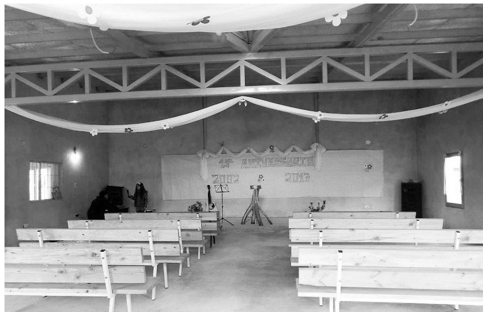
El templo por dentro.

El Señor es muy bueno con nosotros y suple en abundancia para todas las necesidades. A medida que crecía el número de congregados y las diferentes actividades se presentaban, se iba avanzando de igual forma con la construcción. Cuando ya en nuestro hogar que inicialmente hacíamos las reuniones, no cabíamos más, nos pudimos reunir en lo que hoy es la cocina del templo; cuando la cocina no era suficiente (sobre todo con los niños) se habilitó la planta alta; y ahora como un regalo del cielo, nos reunimos en el templo propiamente dicho, de 100 metros cuadrados.