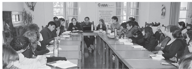
El liderazgo de ABA Jóvenes con representantes de 10 provincias.

Estas actividades finalizaron al mediodía y nuevamente luego del almuerzo y unas breves horas de descanso, tuvimos oportunidad de participar de una charla debate, que hacía a la esencia del lema que nos convocaba, es decir que Queremos los Bautistas para nuestra Nación.