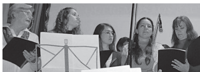
Coro del Congreso

Dejando de lado el cansancio de una larga jornada que incluía más de doce horas de viaje en micro para un buen grupo de asistentes, el auditorio del complejo estuvo completo, participativo y atento para una vez finalizado el período de bienvenida, alabanza y adoración, escuchar los saludos que trajo personalmente el Intendente de Bialest Massé y luego el mensaje en la primer reunión Plenaria.