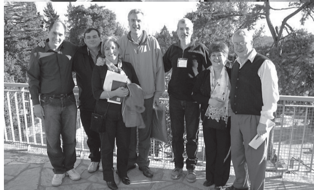
La Fraternidad Pastoral desarrolló su Primer Encuentro dentro del Congreso.

Mientras tanto la tarde del viernes transcurrió con caminatas, visita a las amplias instalaciones incluido el uso de una pileta de natación cubierta y juegos y competencias a cargo de los responsables del Área respectiva.