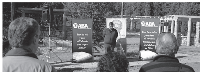
Celebración del día de la Independencia de la Patria.

Tal como estaba previsto en el Programa, cerca del mediodía del 9 de julio, en el Patio de las Banderas se entonó el Himno Nacional Argentino se dió lectura a la Declaración por el Bicentenario de la Patria y se tuvo un tiempo de oración por nuestro país.