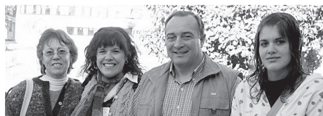
Epígrafe de foto

Los abrazos, las fotos de distintos grupos que querían guardar para siempre los buenos momentos compartidos y las expresiones de afecto y agradecimiento al Señor y a los hermanos presentes, sean tal vez las imágenes finales de este Congreso, literalmente irrepentible.