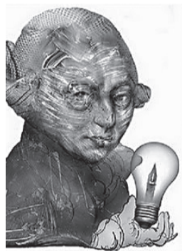
Emmanuel Kant (1724 - 1804)

Kant le hace una gran concesión a Hume: todo conocimiento empieza en la experiencia. No buscará las condiciones de posibilidad del conocimiento en el objeto, sino en el sujeto, con lo cual realizará "un giro copernicano".